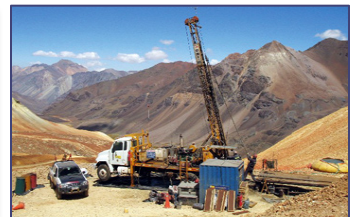
[ Minería ] Interoperabilidad Radio