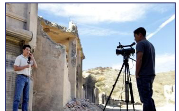
[ Live Streaming 256k ] Noticieros en Vivo