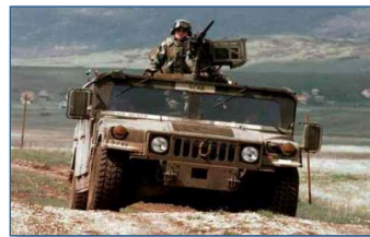
[ Milicia ] Comunicaciones Remotas